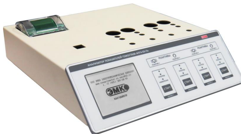
Рис. 1. Коагулометр АПГ4-03-ПХ.

ООО МЛТ, входящее в Группу компаний ЭМКО, в 2015 году начало продажу новой серии инновационных полуавтоматических коагулометров – Анализаторы показателей гемостаза: АПГ2-03-П, АПГ2-03-Пх, АПГ4-03-П, АПГ4-03-Пх с принадлежностями, регистрационное удостоверение № РЗН 2015/2379 от 05.02.2015г. (Рис. 1).